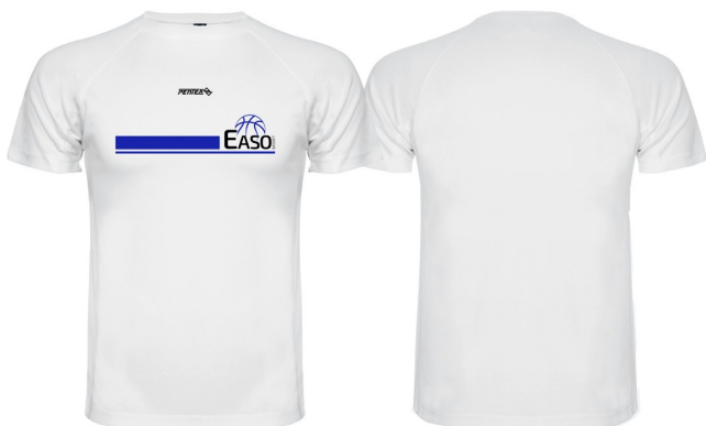
CAMISETA TÉCNICA BLANCA PASEO