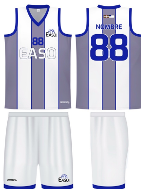
PANTALÓN BALONESTO SUBLIMADO BLANCO