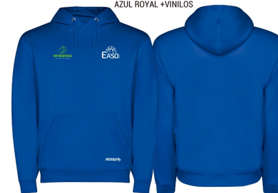
SUDADERA DE CAPUCHA FELPA AZUL ROYAL + VINILOS