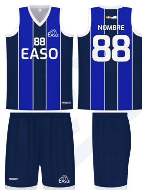
PANTALÓN BALONESTO SUBLIMADO AZUL