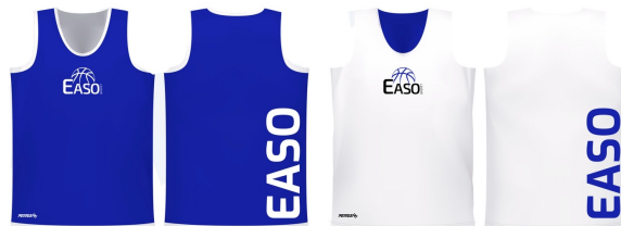
REVERSIBLE 1 TEJIDO SUBLIMADA POR LOS DOS LADOS