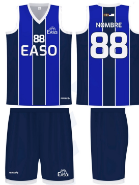
PANTALÓN BALONESTO SUBLIMADO AZUL