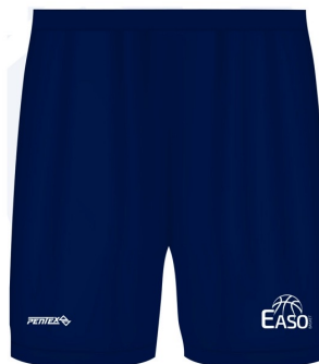
BERMUDA MICROFIBRA AZUL MARINO