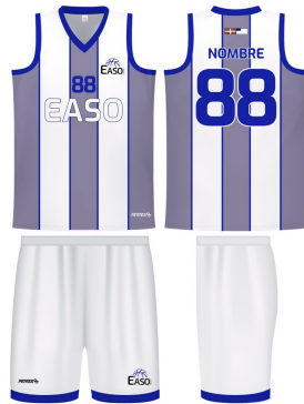
PANTALÓN BALONESTO SUBLIMADO BLANCO