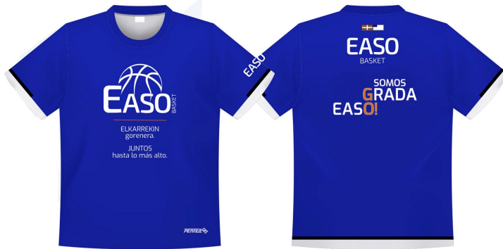
MOD.1: CAMISETA M/C CUBRE SUBLIMADA

Camiseta, bufanda y pancarta para animar a nuestro club.