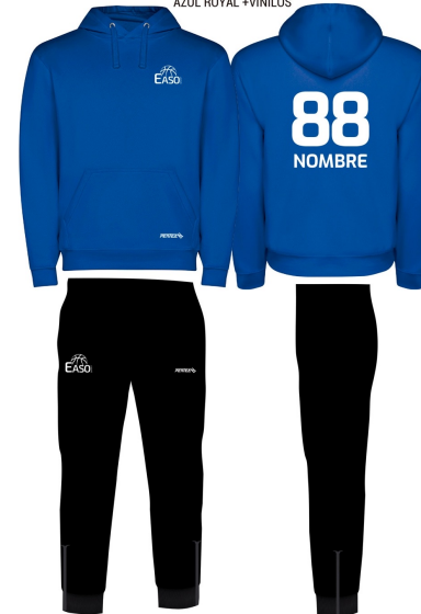
PANTALÓN PITILLO PUÑO Y CREMALLERA NEGRO