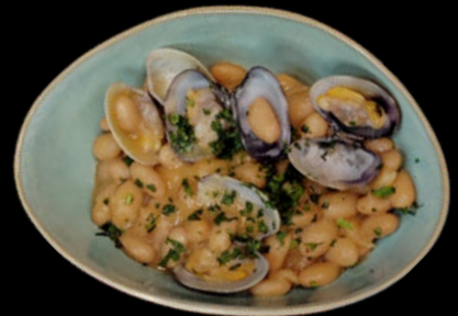
Alubias con almejas 4,90€/ tarro 320gr