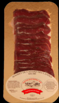
JAMÓN DE PATO SOBRE 80GRS UNID 7,60€/UNID