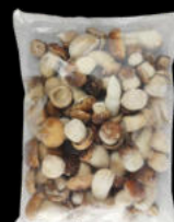
HONGO BELTZA ENTERO MEDIANO EXTRA CONGELADO 1KG 21,70€