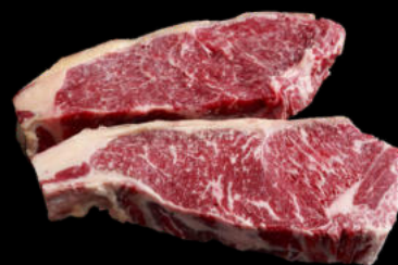
ENTRECOT DE VACA SELECCIÓN +5 URREMAI 24,17€ /KG