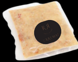
DESMIGADO BUEY DE MAR BLANCO CONGELADO URREMAI 41,75€ /500GR