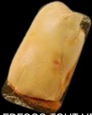
FOIE FRESCO TOUT VENANT AL VACÍO +-650GR 46,25€/KG