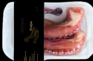
PULPO COCIDO EN SU JUGO 2 PATAS 400/600GR 44,70€ /KG