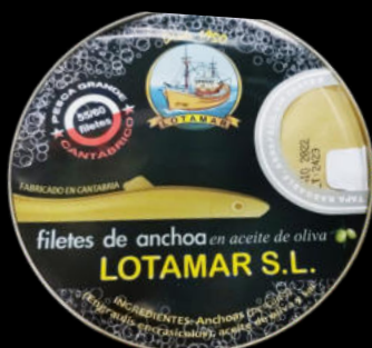
ANCHOA CANTÁBRICO A.VEGETAL 65-75F RO550 LOTAMAR 19,80€ LATA