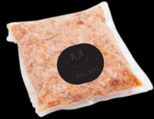
DESMIGADO BUEY DE MAR CORAL CONGELADO URREMAI 27,50€ /500GR