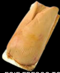
FOIE FRESCO TOUT VENANT DESVENADO +-650GR 49,25€/KG