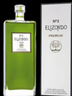
ACEITE DE OLIVA VIRGEN EXTRA PICUAL N°3 ELIZONDO 500ML 18,90€