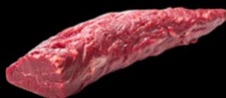
SOLOMILLO FRESCO SELECCIÓN URREMAI | +2.5 KG 30.84€ /KG