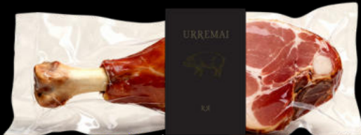
CODILLO JAMÓN COCIDO CH URREMAI | 1,8 KG X 6 6,59€ /KG