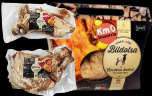
CORDERO LECHAL PREASADO KMO ESTUCHADO 22,31€ /KG