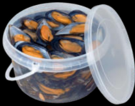
CUBO DE MEJILLÓN MEDIA CONCHA 3,5KG 1X4 URREMAI 28,05€