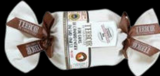
FOIE GRAS MI CUIT TELA ENTERO 100% 180 GR UNID 25,00€/UNID