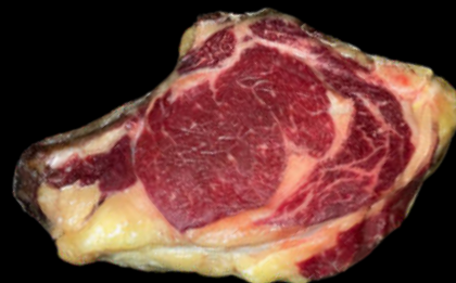
TXULETA SELECCIÓN URREMAI | 1 KG +/- 27,51€ /KG