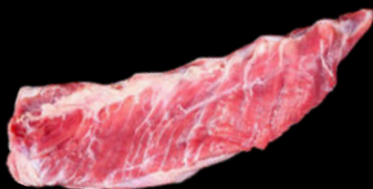
ENTRECULA TERNERA URREMAI | 2 KG +/- 15,84€ /KG