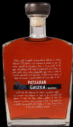
PATXARAN BARAÑANO 9,40€