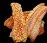
TORREZNO EXTRA URREMAI | BJA 1,5 KG X 4