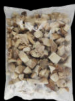
HONGO BOLETUS DADO CONGELADO 1KG 11,20€