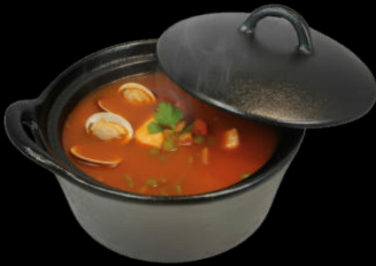
Sopa de Pescado 12,45€/ tarro 700gr

RECETAS listas para abrir, calentar y comer)