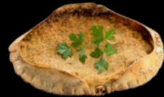
CONCHA RELLENA TXANGURRO DONOSTIARRA 12UDX1CAJA 7,90€ UNID.