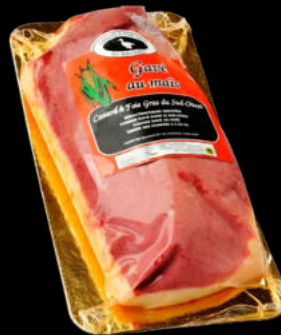
MAGRET DE PATO 350GRS +- 29,85€/UNID