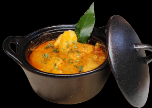
Marmitako de Bonito del Norte 5,20€/ tarro 320gr