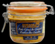
FOIE GRAS ENTIER BOCAL FCO DE 180 GR UNID 22,55€/UNID