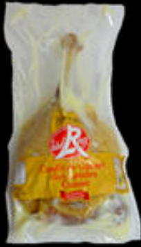
CONFIT DE PATO CONFITADO INDIVIDUAL 350GRS +- 4,95€/UNID