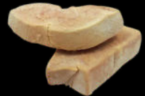
ESCALOPIN FOIE FRESCO 50GR TUPPER +-600GR 58,00€/KG