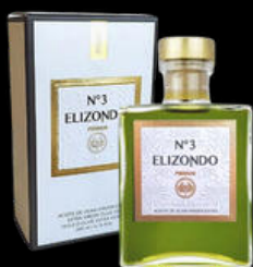
ACEITE DE OLIVA VIRGEN EXTRA PICUAL N°3 ELIZONDO 200ML 9,80€