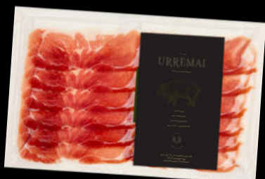
PALETA IBÉRICA 50% CEBO S.H. LAZARO 4,85€ sobre 100gr