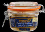
FOIE GRAS ENTIER BOCAL FCO DE 120 GR UNID 18,85€/UNID