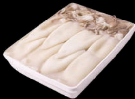
CALAMAR LIMPIO CON PIEL 12-15CM 2 KG 17,20€ /KG