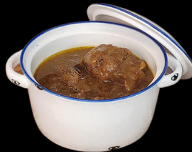
Rabo estofado 8,50€/ tarro 320gr