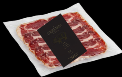
PALETA BELLOTA IBÉRICO 100% BLAZQUEZ 8,30€ sobre 100gr