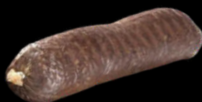
MORCILLA BURGOS TRADICIONAL 300GR URREMAI 5,33€ /KG