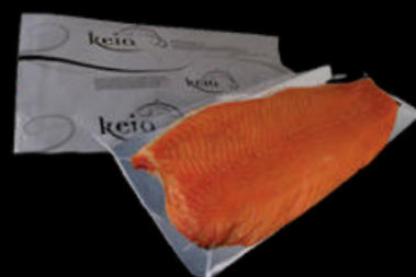
PLANCHA DE SALMÓN AHUMADO PRECORTADA KEIA 2 MITADES 46,85€