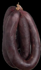
MORCILLA FRESCA OLANO | TXORTA 10,81€ /KG