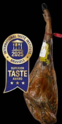
JAMÓN BELLOTA IBÉRICO 50% BLAZQUEZ pata 7-8kg 43,60€ /kg