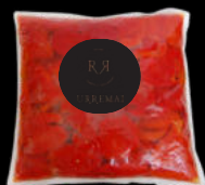
PIMIENTO PIQUILLO ASADO CONGELADO 2KG 23,85€ BOLSA