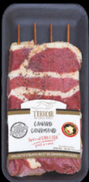
BRONCHETA DE MAGRET PATO BAND. 80GRS +- 36,70€/KG