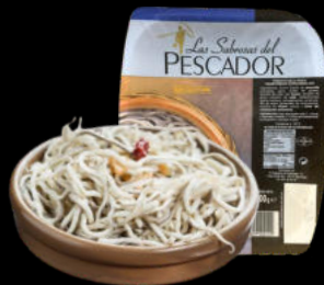
GULAS SIBARITAS 200GR 2,50€ /200GR