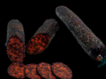
VELA MORCILLA IBERICO BLAZQUEZ 390GR 8,80€ Unid.