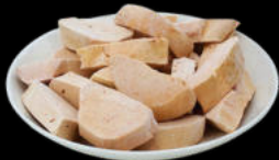
ESCALOPIN FOIE FRESCO 30GR TUPPER +-600GR 57,00€/KG