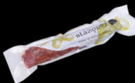
LOMO IBÉRICO BELLOTA SELECCION BLAZQUEZ 5,90€ sobre 100gr