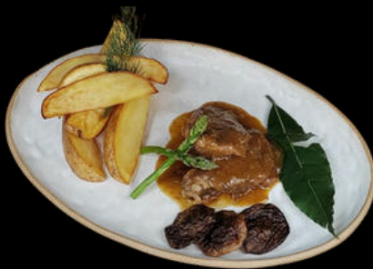
Carrillera en salsa de vino Tinto 7€/ tarro 320gr